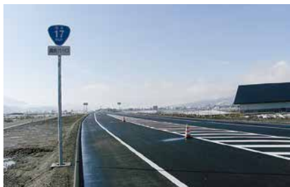
国道17号バイパス完成