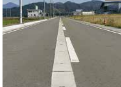
雪に強い水の郷 ～消雪パイプ完備～