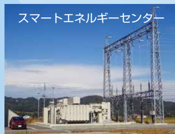
スマートエネルギーセンター

水の郷立地企業連携により、2023年11月から60,000Vの特別高圧受電、各社への電力供給がスタートしました。