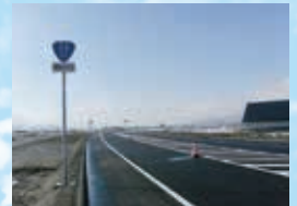
国道17号バイパス完成