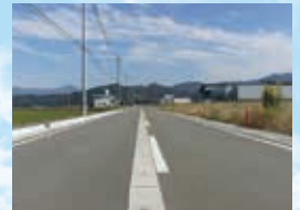
雪に強い水の郷 ～消雪パイプ完備～