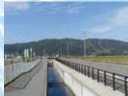
整備された県道及び 専用排水路